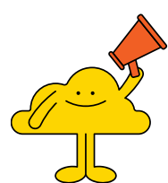
李家乐报导 (4 Harmony)