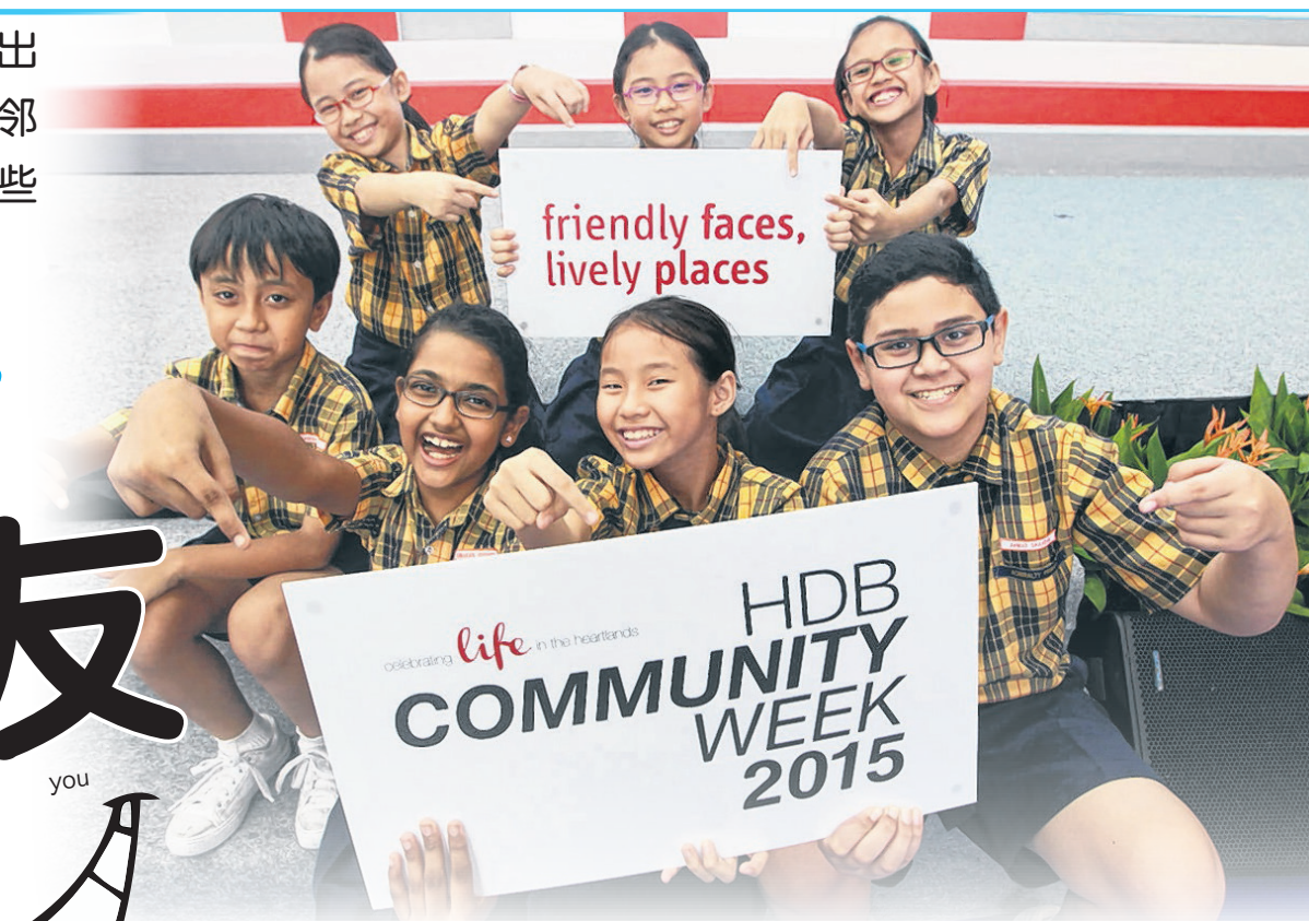
获得杰出项目奖的美雅小学学生在社区精神周开幕当天展出他们的得奖计划。

学林小学的好邻居计划获得杰出项目奖。展摊的“五石子”游戏吸引了不少年长者，让他们重温童年乐趣。